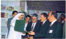
كتب : عبدالله الخفيف.

شهد اليمن في الفترة من ٢٩ ربيع الثاني إلى ١٦ جمادى الأولى تظاهرة ثقافية كبيرة تمثلت في قيام معرض صنعاء الدولي الثاني عشر الذي دعت إليه وزارة الثقافة والسياحة وأقيم في جامعة صنعاء الجديدة في وادي ظهر.