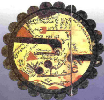
صورة دائرة الأرض نقلًا عن الإبرسي في رسمه لصورة الأرض