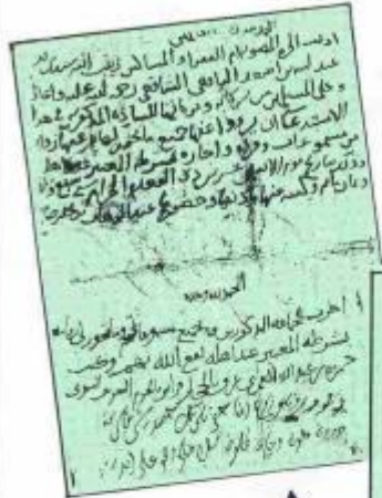
▲ صورة السماع