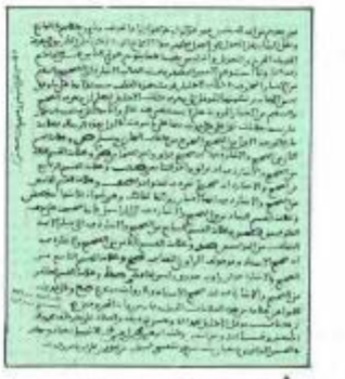
▲ الورقة الأخيرة من المدخل

أما مجموعة الإجازات فمن بينها إجازة معنونة من محمد بن أحمد بن محمد الكازوني، كتبها في عام ٧٤٧هـ بمكة المكرمة، وإجازة من زينب بنت عبدالله بن أسعد اليافعي برواية جميع ما يجوز لها وعنها. وهذا المجموع إلى جانب أهميته العلمية يعد على درجة كبيرة من الأهمية لدارسي تاريخ الثقافة الدينية، وكذلك لدارسي علم البليغرافيا.