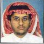
محمد آل الشيخ