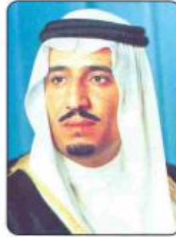
صاحب السمو الملكي الأمير سلمان بن عبدالعزيز

وإننا نقدم هذا النموذج من تلك المجموعة مثلاً لما يمكن أن تستفيد منه حركة البحث العلمي في التاريخ العربي والمحلي لتوضيح حقائق غائبة، وكشف معلومات، وتصحيح أخطاء.