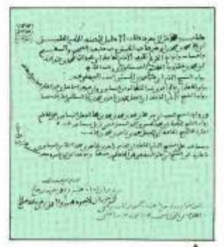
▲ الورقة الأولى من المدخل

من بين المخطوطات التي اقتنتها المكتبة في عام (١٤١٣هـ) نسخة من كتاب (المدخل إلى معرفة كتاب الإكليل) تأليف الحافظ أبي عبدالله محمد بن عبدالله بن محمد بن حمويه الحاكم النيسابوري (٣٦١ - ٤٠٥هـ). وعلى الرغم من أن الكتاب قد نشر مرتين، الأولى في حلب ١٩٢٢م بعناية محمد رغب الطباخ، والأخرى في لندن عام ١٩٥٣م بعناية جيمس رويسون، إلا أن لهذه النسخة التي اقتنتها المكتبة أهمية كبيرة، فهي منسوخة في عام ٥٩٧ هجرية في بغداد، كما أنها تضمنت في آخرها (سماع) لناسخها أبي إسحاق إبراهيم ابن محمد بن إبراهيم بن همام الأندلسي الإشبيلي على محمد بن أحمد بن الحسن المذائني، الذي أجازته برواية الكتاب أبو القاسم زاهر بن طاهر ابن محمد الشجاعاني إجازة من الإمام أبي بكر أحمد بن الحسين البيهقي الذي سمعه عن الحاكم