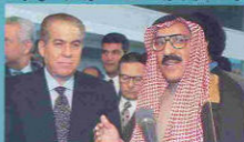
سعادة الأمين مع وزير الأوقاف المصري أثناء تفقده جناح المكتبة